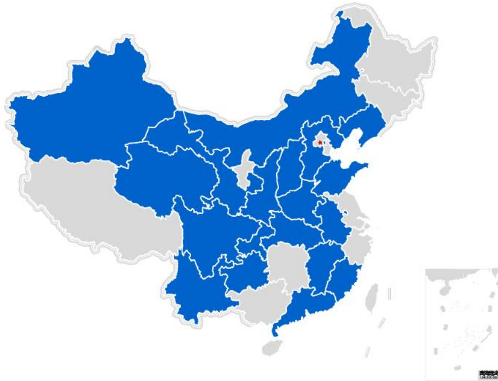
2023 年童书乐捐计划受益项目点覆盖图