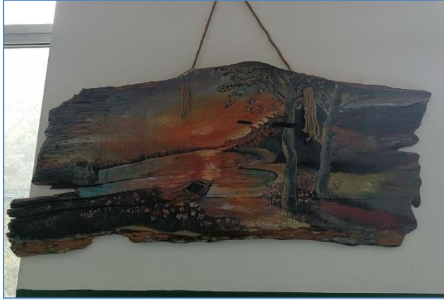
豆坝镇九年制学校学生在树根上制作的画