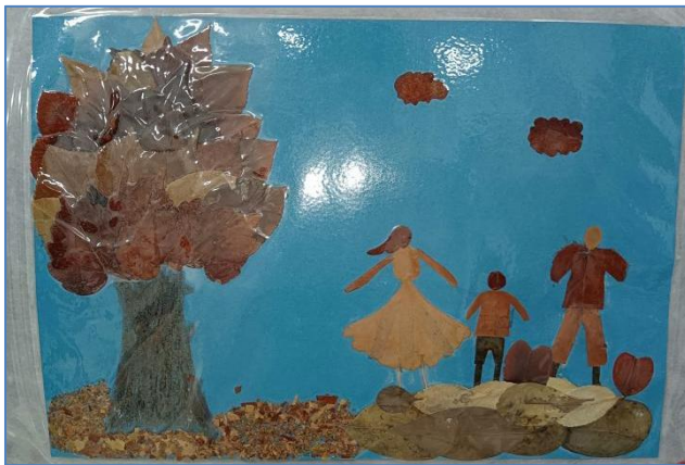
康县城关第三小学学生用枫叶制作的画