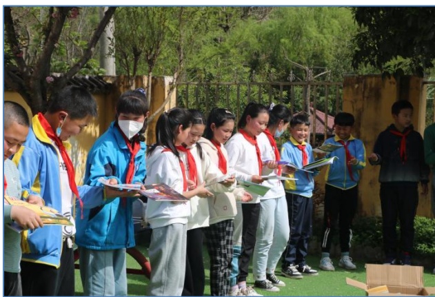
大堡镇巩集小学的传书活动