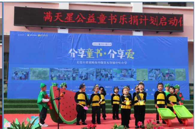
大堡镇中心幼儿园绘本剧《蚂蚁和西瓜》