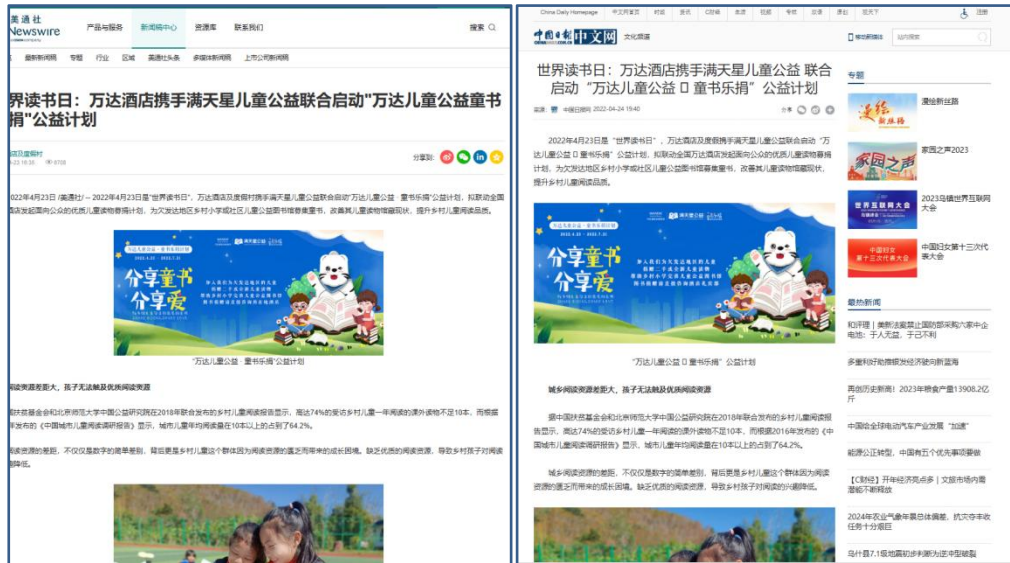
项目启动的媒体报道（部分）