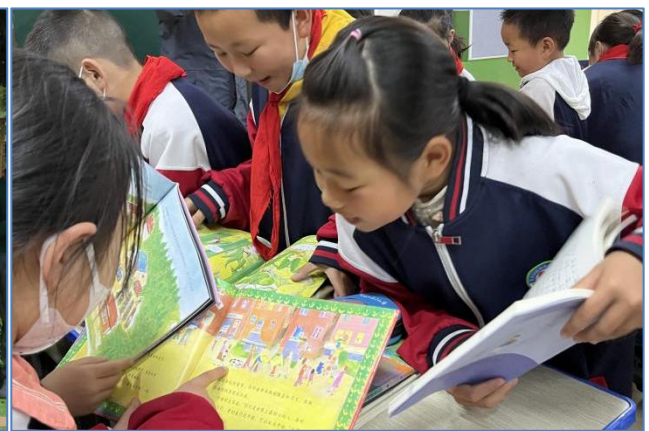
铜钱镇九年制学校同学们在分享交流