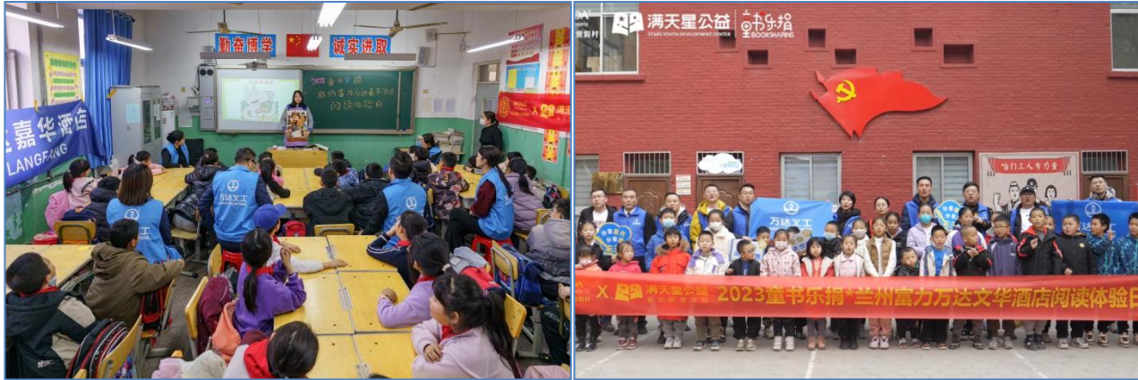
河北廊坊霸州市第十一小学的绘本故事会 阅读体验日活动走进兰州安宁区益兴社工中心所在社区