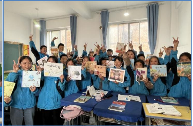
豆坝镇九年制学校同学们开心展示自己喜欢的书籍