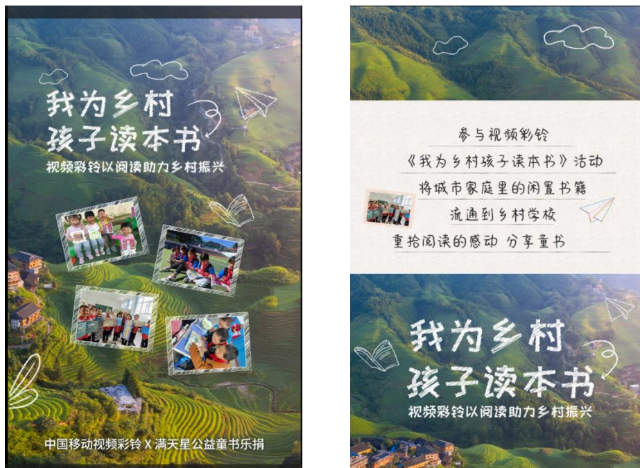
中国移动彩铃视频

4月，童书乐捐项目联合中国移动咪咕音乐携手冬奥四金得主王濛、全网粉丝超3千万儿童类大V王蓝莓等有影响力的公众人物，通过定制公益视频彩铃的方式，号召更多爱心伙伴关注乡村儿童阅读。9月，童书乐捐项目首次上线腾讯公益平台99公益日筹款，让更多公益行为被看见和记录。