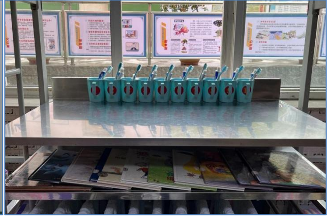
碾坝镇中心小学同学们的宿舍随处可见绘本