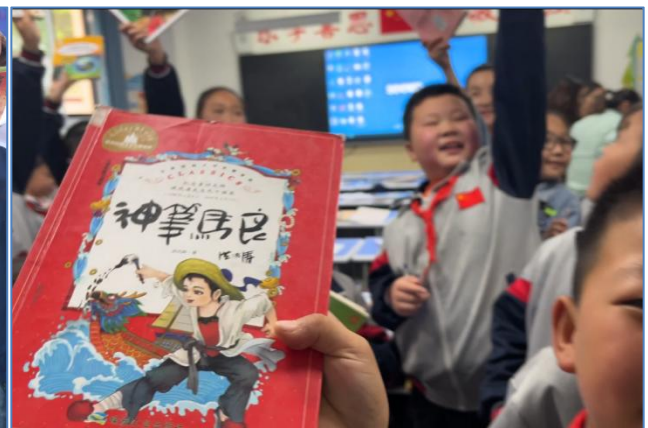
康县城关第三小学同学向项目人员分享自己喜爱的书籍