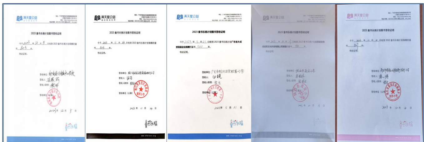
受益项目点的签收证明（部分）