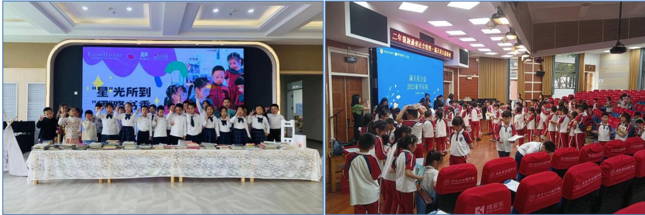
新加坡伊顿国际教育集团（哈尔滨）校区的捐书仪式 广东碧桂园二年级通融班的捐书仪式