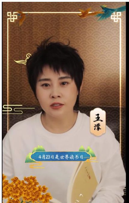
冬奥四金得主王濛深情朗诵