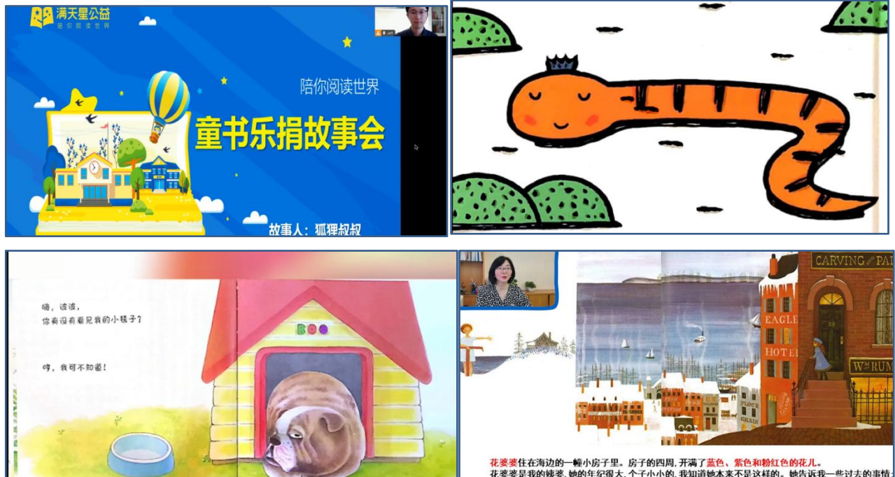
志愿者录制的绘本故事会视频截图（部分）