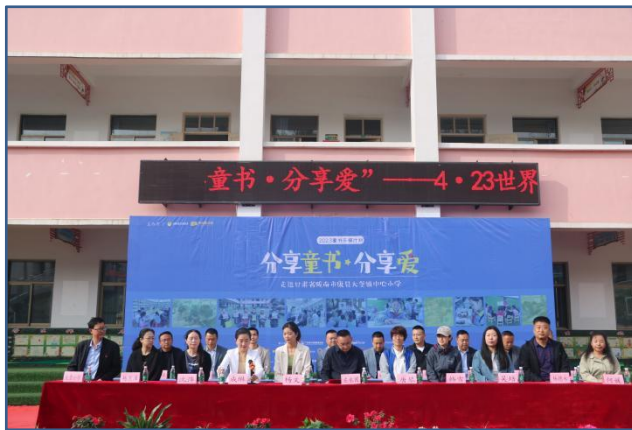
在甘肃陇南县大堡镇中心小学的启动仪式