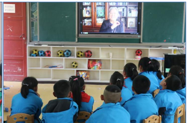
中国第一位获得 BIB 金苹果奖绘本作家蔡皋老师的分享