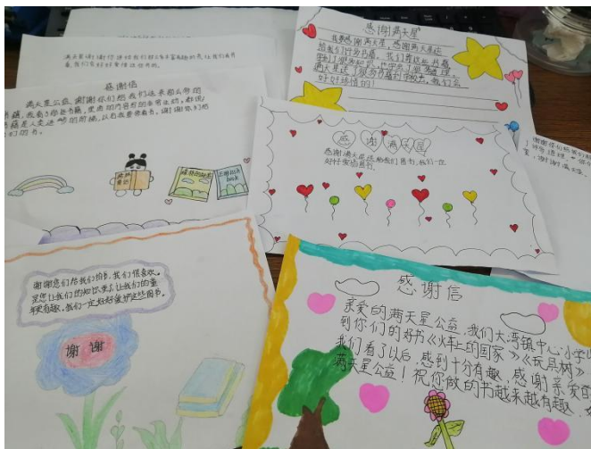
广东云浮郁南县大湾镇中心小学同学们的感谢信