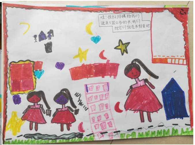
贵州省瓮安县第六幼儿园孩子们的感谢画