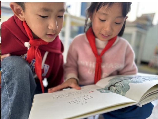
河南辉县孟庄镇南陈马村的孩子们在看捐赠的童书