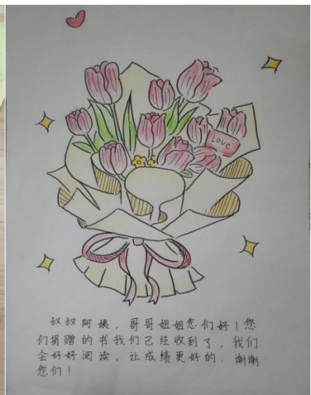
云南宣威务德镇中心幼儿园的感谢画 河南新密东大街小学感谢画 广东云浮郁南宋桂镇中心小的感谢画