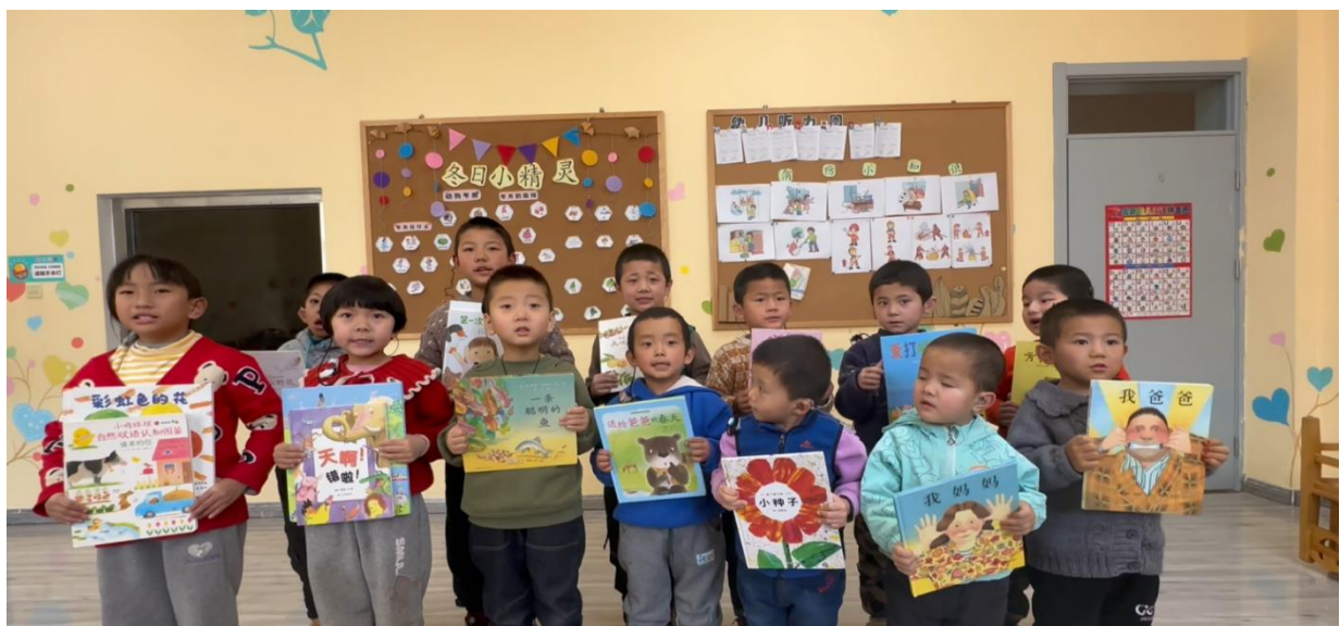
青海省海东市残疾人康复服务中心的听力障碍的孩子们收到童书乐捐寄去的书录制了感谢视频