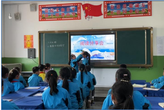
正好碰上碾坝镇中心小学班级阅读分享会