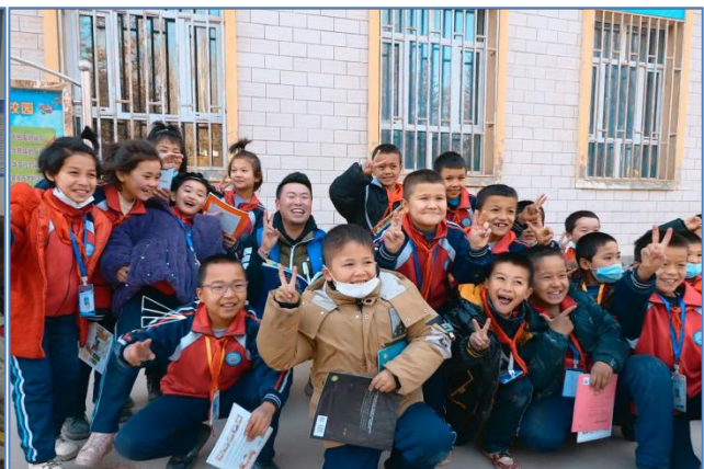
新疆吐鲁番高昌区胜金乡中学的户外传书环节