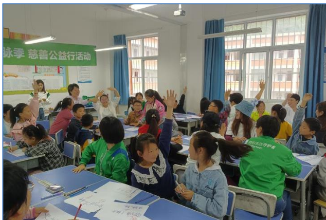
陕西商洛山阳板岩镇中心小的绘本故事会