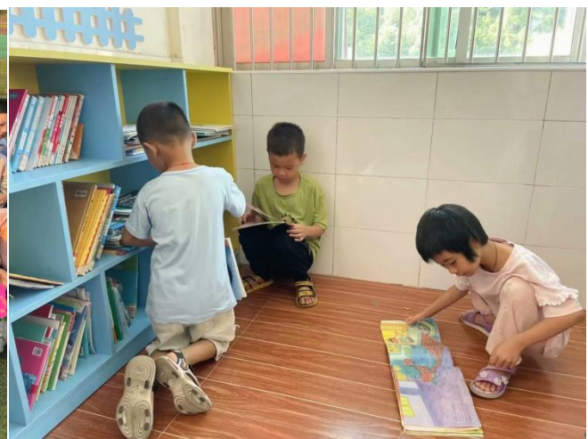
广东云浮新兴河头镇中心小收书用于班级图书漂流活动 广东云浮郁南大方镇中心小收书上架后即时阅读