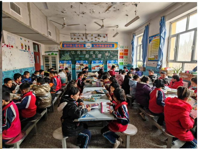
新疆吐鲁番市高昌区胜金乡中学收到捐赠的书和书架专门腾出一间空置教室作为阅读课活动场所