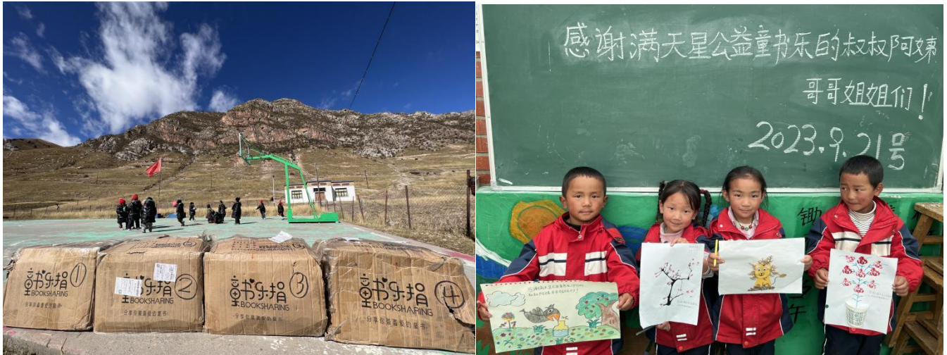
地处高原的青海省玉树藏族自治州囊谦县囊谦觉拉扎西格森民办幼儿园孩子们收到童书乐捐寄去的书