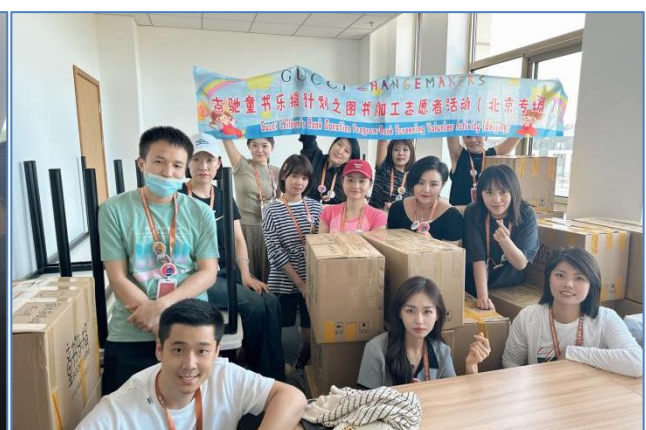
古驰(中国)志愿者完成图书加工