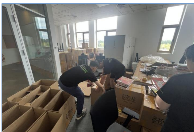
德勤(中国)志愿者在进行图书加工

自项目启动后，各合作企业单位和学校都紧锣密鼓地发动线上线下各方资源，进行团体收书，按照操作指南对书本进行分拣、加工、平台录入和寄送。