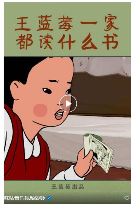
儿童类大V王蓝莓通过视频彩铃号召捐书