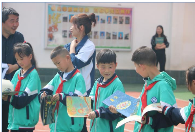
大堡镇中心小学传书活动