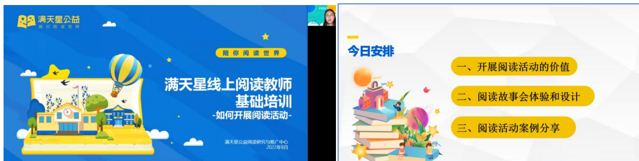
8月22日的线上受益项目点老师培训

与以往一样，2023 童书乐捐有大量难以统计的来自各个领域的志愿者参与活动的图书募集、筛选、加工和寄送。项目组除提供图书资源的同时，持续在暑假期间开展每年一次的线上受益项目点绘本阅读培训，