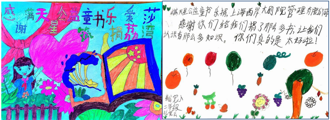
受益项目点孩子们的感谢信（画）（部分）